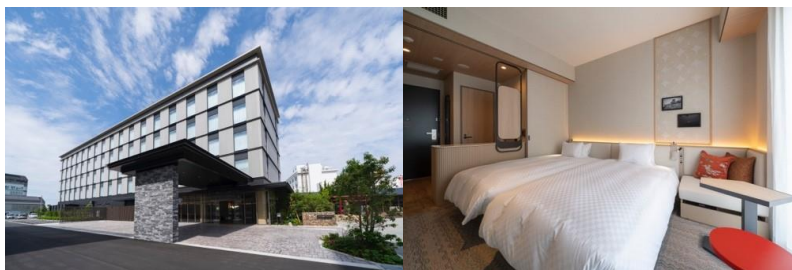
※お部屋のイメージ: モデレートツイン

詳細はこちらから( https://www.m-inuyama-h.co.jp )