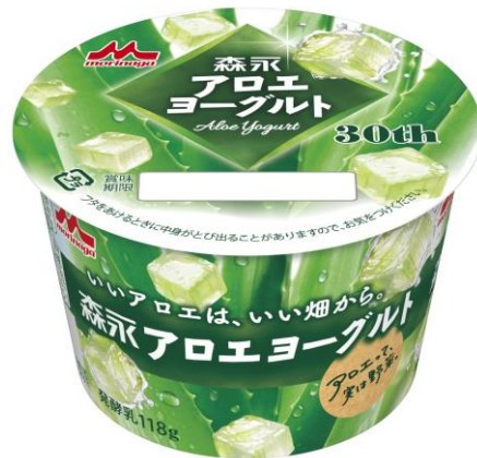
「森永アロエヨーグルト」新パッケージ

1994 年 12 月 10 日に誕生した「森永アロエヨーグルト」シリーズは、“健康素材であるアロエの持つ力とおいしさを提供する”というブランドコンセプトのもと、アロエの“みずみずしい食感”とヨーグルトの“爽やかな味わい”を発売以来お届けしてきました。これまで多くのお客さまにご愛顧いただき、おかげさまで 2024 年 12 月に発売 30 周年を迎えました。