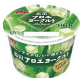
森永アロエヨーグルト