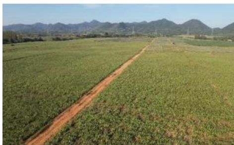
タイのアロエ農園

「森永アロエヨーグルト」で使用しているアロエは、タイの契約農園とともに30年間、畑から大切に育ててきました。日本に輸入されたあとも、「アロエの鮮度、みずみずしさ、独特の歯ごたえ」を大切に保管しています。みずみずしいアロエの鮮度を逃さず、常に安定した品質が確保された原料を使用するために、日々努力をしています。