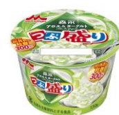
森永アロエヨーグルトつぶ盛り