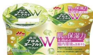
森永アロエヨーグルト W 2 個パック