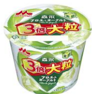
森永アロエヨーグルト 3 倍大粒