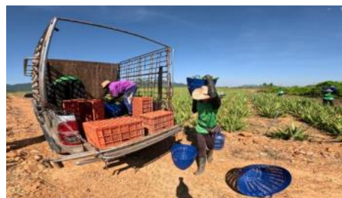
収穫したアロエの積み込み風景