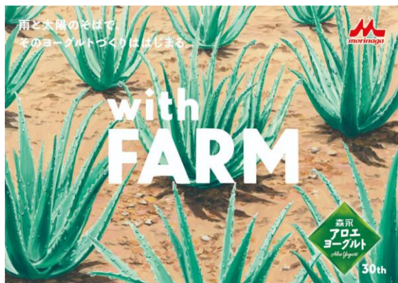
新 TVCM「雨と太陽のそばで」篇

森永乳業は、2024 年 12 月に発売 30 周年を迎えた「森永アロエヨーグルト」シリーズのブランドコンセプトを大幅刷新することとし、その新コンセプトにあわせた新 TVCM「雨と太陽のそばで」篇を 2 月 10 日(月)より全国で放映を開始いたします。また 2 月 3 日(月)週より順次、新パッケージにてリニューアル発売いたします。