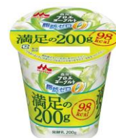
森永アロエヨーグルト 脂肪 0 満足の 200g

2 種類のカットサイズのアロエが入っていて、お いしさと食感を楽しめる食べ応え大満足。