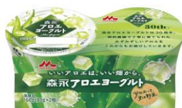
森永アロエヨーグルト 2 個パック