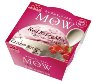
MOW(モウ) 赤いベリーミックス

品質本位の茶づくりに定評のある丸久小山園のまるやかな旨みの特徴の蔵出し抹茶を使用した緑色の宇治抹茶アイスと、当社が本製品限定に調達した“芳しい薫り”が特徴の焙煎抹茶を使用した薄緑色の宇治抹茶アイスの2種類を混ぜ合わせ、見た目の色や味の違い、調和がお楽しみいただけます。