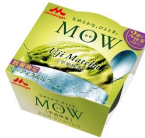
MOW(モウ) 宇治抹茶 (数量限定)

単一産地のカカオ豆のみ使用し、その個性あるカカオの味わいにこだわった「シングルビーンチョコレートアイス」です。エクアドル産カカオを100%使用し、特有の軽やかでフローラルな香りと、カカオの程良い苦みが楽しめます。