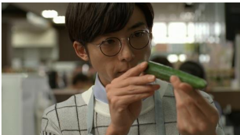
[C-2]高橋さん「きゅうりはトゲトゲ」