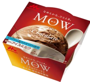
MOW(モウ) チョコレート ～エクアドルカカオ～

プレミアムアイスクリームでも使われる、国産の脱脂濃縮乳やクリームといった液状乳原料を使用し、濃厚でコクのある味わいが楽しめます。より芳醇なバニラの香りが広がる深みのある味を目指し、2017年3月にミルクとバニラの風味のバランスを改良しました。