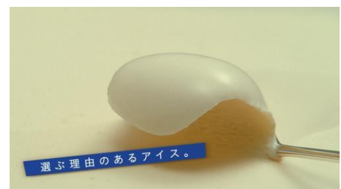
[C-8]高橋さん「選ぶ理由のあるアイス」