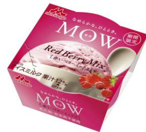
MOW(モウ) 赤いベリーミックス

単一産地のカカオ豆のみ使用し、その個性あるカカオの味わいにこだわった「シングルビーンチョコレートアイス」です。エクアドル産カカオを100%使用し、特有の軽やかでフローラルな香りと、カカオの程良い苦みが楽しめます。