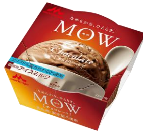
MOW(モウ) チョコレート ～エクアドルカカオ～

プレミアムアイスクリームでも使われる、国産の脱脂濃縮乳やクリームといった液状乳原料を使用し、濃厚でコクのある味わいが楽しめます。より芳醇なバニラの香りが広がる深みのある味を目指し、2017年3月にミルクとバニラの風味のバランスを改良しました。