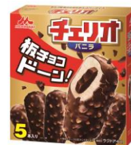
チェリオ バニラ (5本入り) 希望小売価格:オープン 内容量:55ml×5本