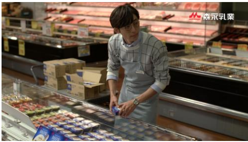
[C-1]主婦「りんごジュース買う？」