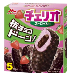
チェリオ ストロベリー (5本入り)