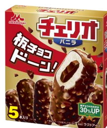
チェリオ バニラ (5本入り)