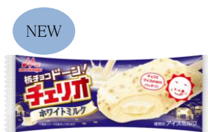
チェリオ ホワイトミルク (1本入り)