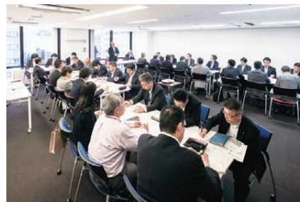
第1回CSR委員会は、2016年7月に開催されました