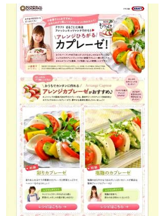
【クックパッド】*イメージ

1983年11月1日生まれ。グラビアアイドルとしてデビューし、その後2011年に結婚、2012年6月に男の子を出産し現在ママとしても大奮闘中。特技は料理とパン作りで、『小倉優子の幸せごはん』(講談社)は10万部を突破。ブログで発信するかざらない毎日ごはんが評判となり、同世代の女性たちからも高い支持を得ている。