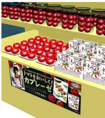
* トマト売り場関連販売例