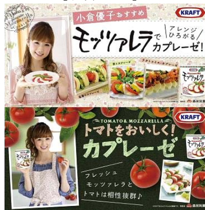
* 両面印刷トップボード