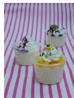
【商品開発シートとオリジナル商品の完成イメージ】

また、森永乳業とKCJ GROUPは今後の展開として、キッズニアを飛び出し「実社会の仕事」を体験できるプログラム『Out of KidZania』の開催も検討しています。このプログラムでは、こども達が食生活を支える「いきもの」に触れ、命をいただいていることに気づく機会を提供するとともに、おいしく、安全・安心な商品がどのように作られ、食卓へ届くのかを学ぶことができる体験を提供する予定です。