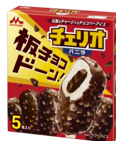
チェリオ バニラ(5本入り) 希望小売価格:オープン 内容量:50ml×5本