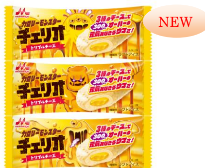
カロリーモンスターチェリオ トリプルチーズ(1本入り) 希望小売価格:140円(税別) 内容量:85ml