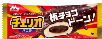
チェリオ バニラ(1本入り) 希望小売価格:140円(税別) 内容量:85ml