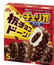
チェリオ バニラ(5本入り) 希望小売価格:オープン 内容量:50ml×5本