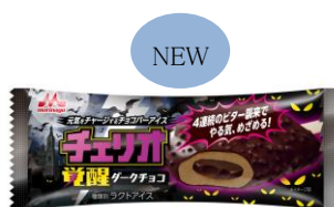
チェリオ 覚醒ダークチョコ 希望小売価格:130円(税別) 内容量:85ml