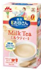
ミルクティー風味