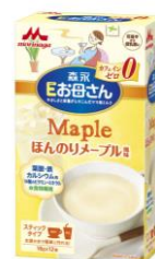
ほんのりメープル風味