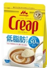
クリープライト袋 210g